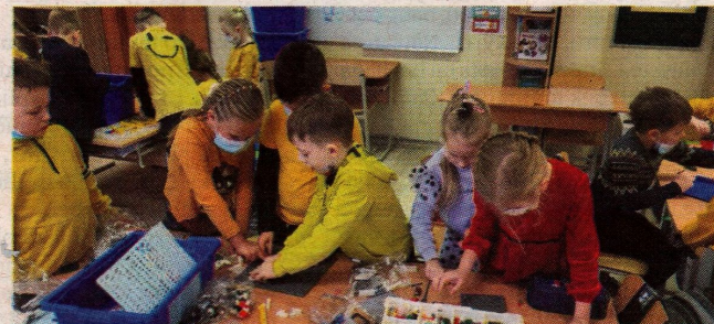
■ Mokymas: motyvaciją stiprina inovatyvių priemonių naudojimas.

„Džiaugiamės Kauno Simono Daukanto progimnazijoje iš-